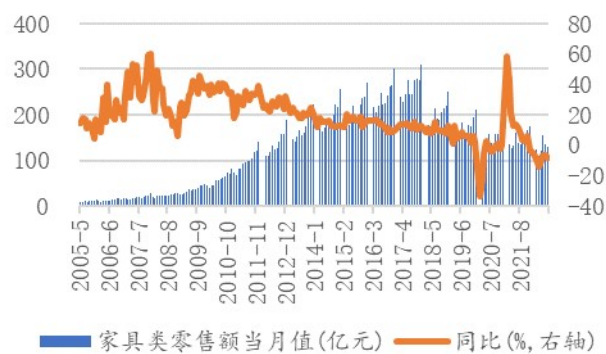
图 2：我国家具类零售额及同比增速